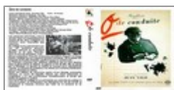
Chang Cycles 1 et 2 - Zéro de conduite Cycle 3