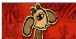
Les contes de la mère poule : Trois petits contes d'animations iraniennes.