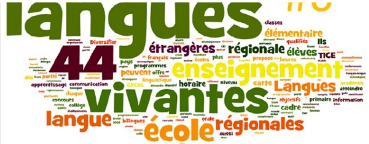
Semaine des langues vivantes 2019