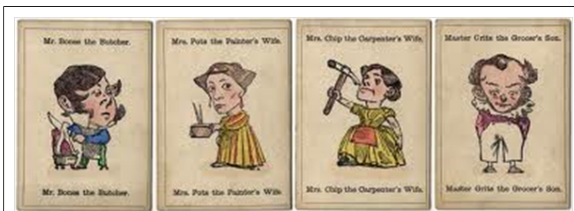
illustrations de J. Tenniel, cartes d'une édition de 1880 publiée par John Jaques & Son.

Lorsqu'un joueur réunit une famille de 4, il la dispose devant lui. Le vainqueur est celui qui s'est débarrassé de toutes ses cartes, et non celui qui a réuni le plus grand nombre de familles.