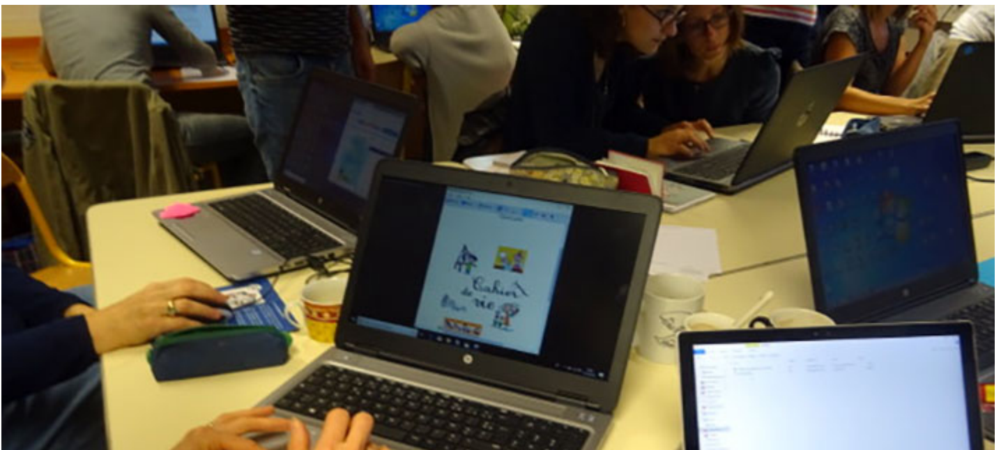
Les enseignants découvrent e-primo

La nouvelle plate forme permet des accès réglementés et impose une charte signée par tous les utilisateurs : enseignants, élèves, parents, collectivités, services académiques. Des liens sont ainsi construits entre tous les temps de l'élève. L'administrateur de l'école (en général le directeur ou la directrice) est chargé de gérer la publication des informations sur l'ENT.