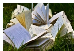
Bibliographie (en cours)