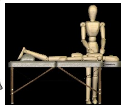
Le massage à l'école