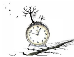
Construire le temps