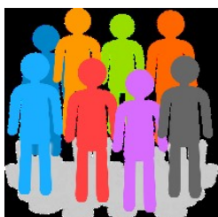
Rituels pour être ensemble