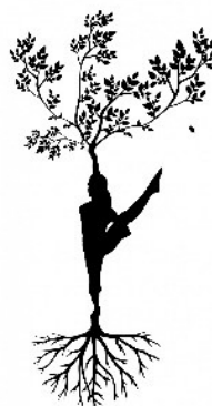
Le yoga à l'école