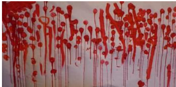
Des coulures en petite section à partir d'une œuvre de Jim Dine

Objectifs : « tout au long du cycle, les enfants rencontrent des graphismes décoratifs issus de traditions culturelles et d'époques variées. Ils constituent des répertoires d'images, de motifs divers où ils puisent pour apprendre à reproduire, assembler, organiser, enchaîner à des fins créatives, mais aussi transformer et inventer dans des compositions. L'activité graphique conduite par l'enseignant entraîne à l'exécution de tracés volontaires, à une observation fine et à la discrimination des formes, développe la coordination entre l'œil et la main, ainsi qu'une habileté gestuelle diversifiée et adaptée. Ces acquisitions faciliteront la maîtrise des tracés de l'écriture ».BO du 26 mars 2015.