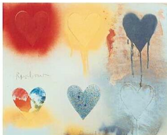
Small Heart Painting n°21 Jim Dine, 1970

Proposer à la classe de découvrir une œuvre du peintre Jim Dine :