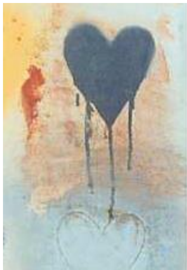
détails des coulures.....

Enrichir la pratique graphique des élèves Laisser les élèves apprécier l'œuvre