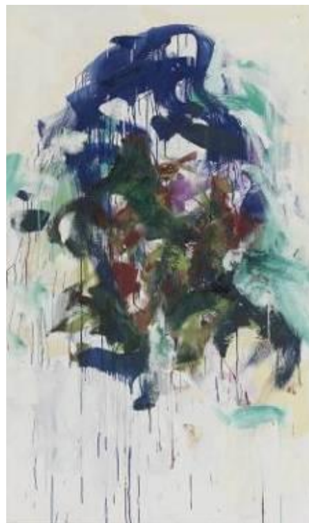
Joan Mitchell, Chord II, 1986