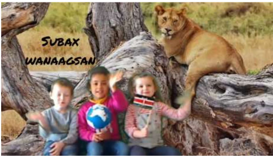
Des élèves de la classe de MS-GS de l'école de Renazé en tournage sur le projet « Voyage autour du monde »