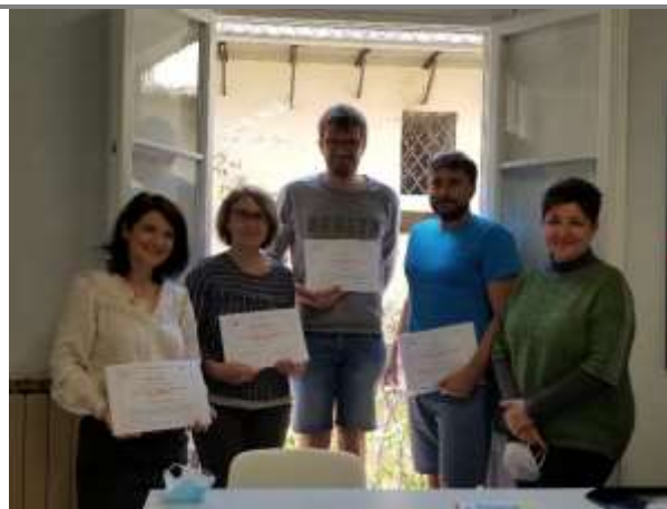
Les stagiaires mayennais et tchèque ont obtenu le « Certificate of attendance » de leur formatrice américaine, à la fin de leur semaine de stage (Italie, mai 2021).

Des appels à projets académiques ont lieu régulièrement à l'initiative de la DAREIC. Si vous êtes intéressé.e.s, contactez la CPD LV 53 ( cpdlv53@ac-nantes.fr ou 02 43 59 92 11).