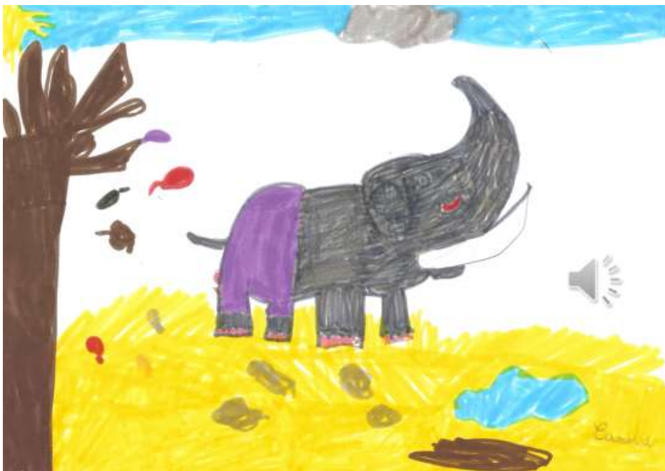
« What colour are your knickers, elephant Myrtle? » (Camille, classe de CE1 de l'école de Bouère)