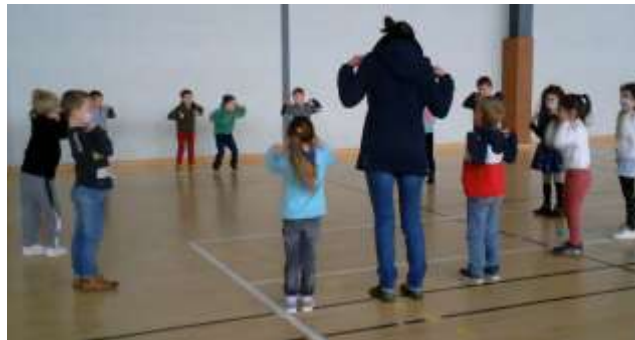
« Jump! Move your shoulders! » Echauffement en anglais en séance d'EPS dans la classe de GS-CP de l'école Robert Doisneau