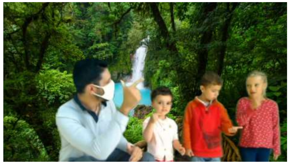
Des élèves de PS-MS-GS et un papa de l'école d'Entrammes comptent en espagnol lors de leur « Voyage autour du monde »