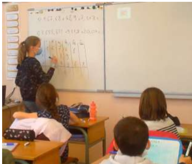
Séance de calculs en anglais dans la classe de CM de l'école Robert Doisneau