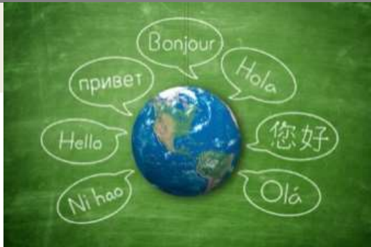
Dossier cycle 1 : voyage autour du monde

Action départementale « Ni hao sounds around! »