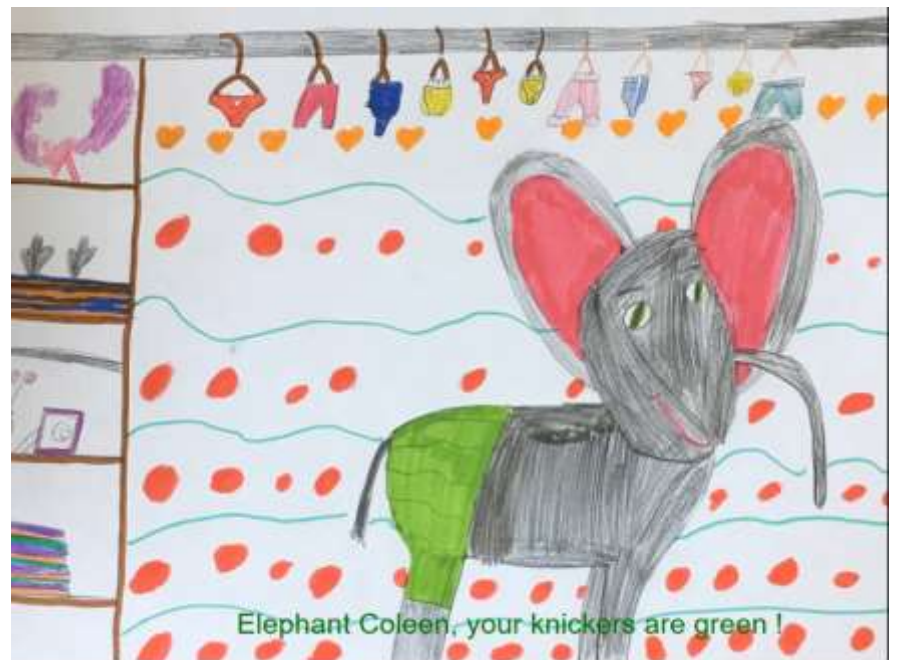
Extrait du livre numérique de la classe de CP-CE1 de l'école de St Georges Buttavent