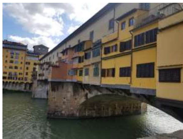
Formation pédagogique et découvertes culturelles sont au programme des mobilités Erasmus + (ici visite du Ponte Vecchio à Florence, Italie – mai 2021)