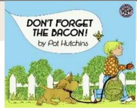
Dossier cycle 3 autour de l'album « Don't forget the bacon! »