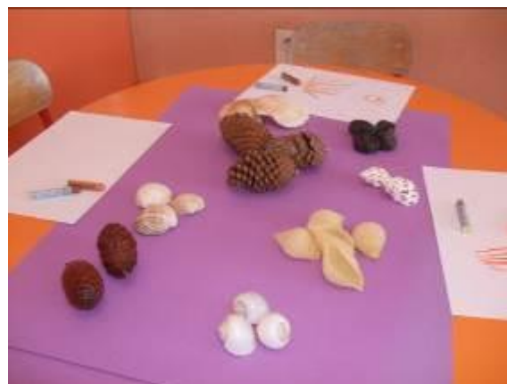
Les éléments naturels, une source d'inspiration graphique infinie.

Concevoir, préparer et évaluer les coins avec précision, en fonction d'objectifs (qu'est-ce que les enfants vont faire et apprendre ?).