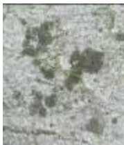
taches sur pierre