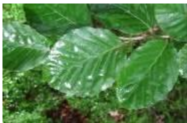
feuilles de hêtre

Savoir adapter son geste aux contraintes matérielles par l’utilisation de nouveaux outils scripteurs.