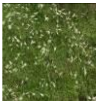
graminées sur mousse

Enrichir la pratique graphique des élèves