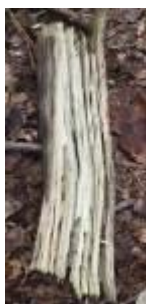
fibres du bois