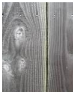
veines du bois