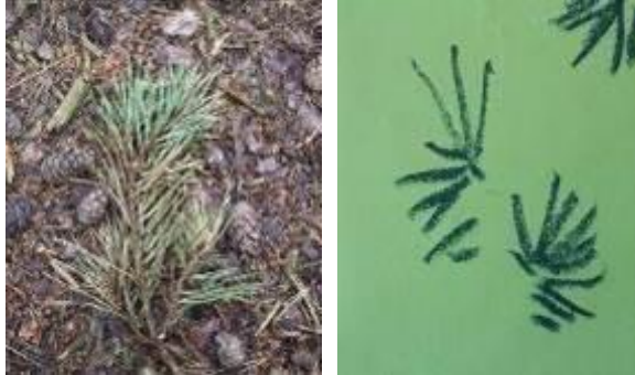
aiguilles de pin

Solliciter les remarques Encourager les échanges