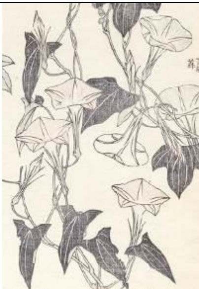
Estampe japonaise, anonyme, 1889

A l'école maternelle, l'enfant doit être capable d'observer et de décrire des œuvres du patrimoine. Découvrir un artiste, en référence à l'histoire de l'art.