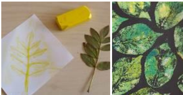
1 – l’empreinte