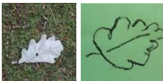
feuille sèche sur mousse

Solliciter des réactions, des échanges vers de nouvelles découvertes.