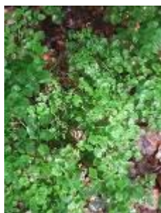
pieds de myrtilliers

Permettre à l'image mentale du motif étudié de se fixer