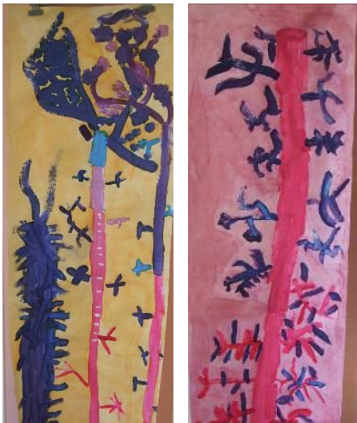
Arbres imaginaires - Bannières réalisées par des élèves de CE1

Le thème de l'arbre se prête bien à une pratique plastique sur très grand format – ici, bannières sur toile TYVEK, d'1m sur 2m50. Chaque groupe d'élèves décide des formes, tailles et coloris des végétaux à représenter. L'occupation de l'espace devient alors une contrainte, induisant un type d'outils et de médiums (ici, tracés à l'acrylique ou à la gouache puis encres pour le fond).