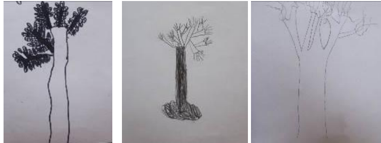
Croquis d'élèves de CE1, arbustes et arbres de la cour d'école.