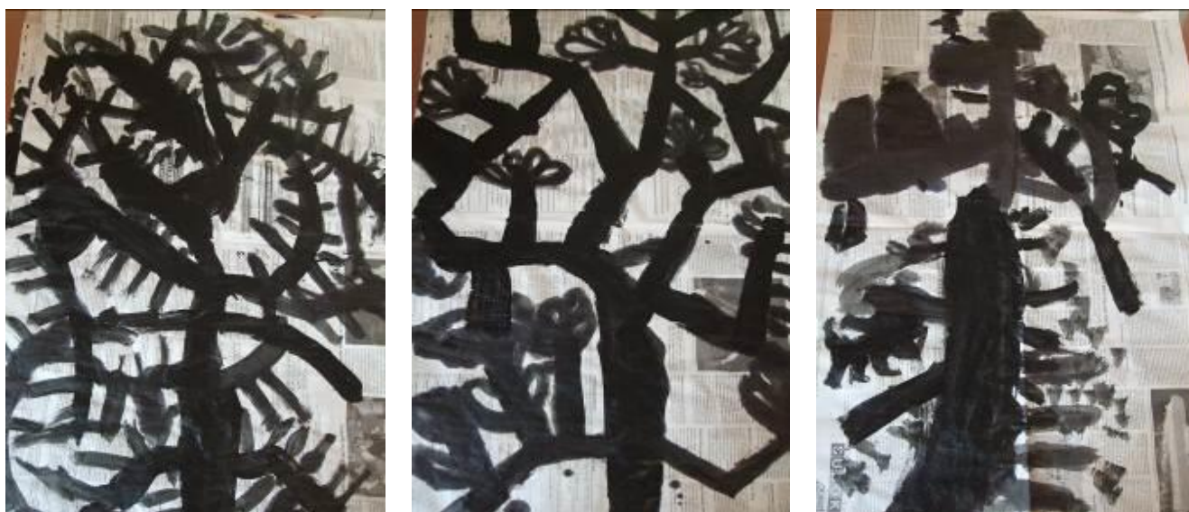
Portrait d'arbres en noir, créations d'élèves de CE1