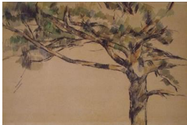
Étude d'un arbre , Paul Cézanne 1890 - crayon et aquarelle

Parfois, une seule oeuvre suffit, mais dans ce cas, il est apparu pertinent de confronter deux œuvres opposées dans leur approche du sujet, dans leur parti pris et leur technique.