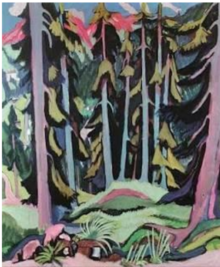
Chemin dans une forêt de montagne Ernst Ludwig Kirchner, 1919 - huile sur toile

À ce stade du projet, on pourra confronter les élèves à un choix d'œuvres de référence pouvant répondre en partie à leur questionnement et/ou provoquer une nouvelle approche de la thématique, ici, comment faire le portrait d'un arbre ?