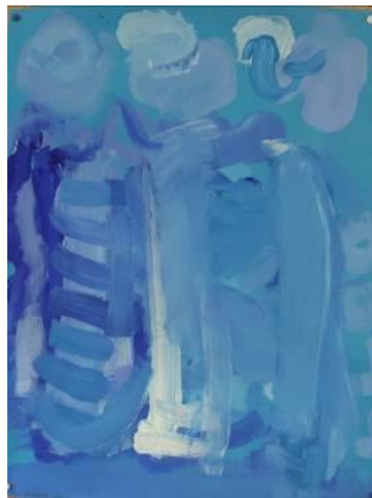
Monochromes sur feuille bleue, compositions d'élèves de CE1

Faire le portrait d'un arbre, ce peut être également l'occasion d'abandonner les stéréotypes (tronc marron et feuillage vert) pour mettre en avant texture, formes et nuances du végétal ... Par exemple, en privilégiant le monochrome, les nuances d'une teinte inhabituelle... Les élèves disposent de la couleur primaire (bleu cyan) et d'outremer, on ajoute du blanc et éventuellement un peu de noir. Les mélanges se font à la palette... On peint sur feuille de la teinte choisie.