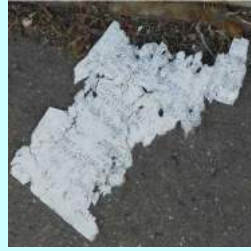
Avec des papiers