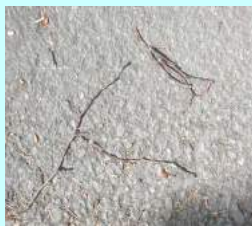
Avec des brindilles qui dessinent...