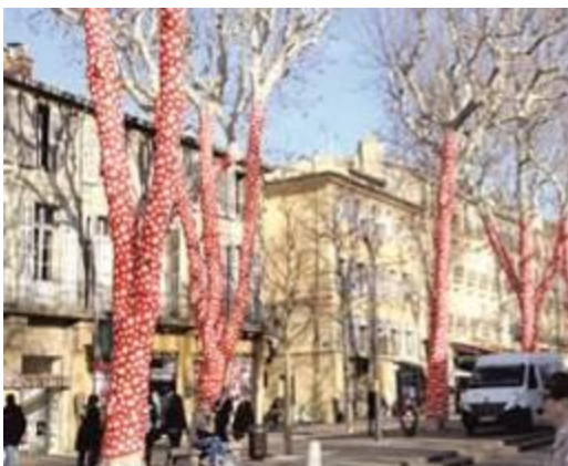
Installation de Y. Kusama à Aix en Provence

Dans la cour de l'école ou l'aire de jeux, divers éléments vont pouvoir être investis par des interventions et des installations colorées, texturées ou graphiques : troncs d'arbres, haies, grillage, portail, fil à linge, bac à sable, jeux... Les éléments se préparent en amont, en arts plastiques, au fil de l'année, ou juste avant l'installation. On va conduire les élèves à se questionner sur ce qui pourrait amener de la couleur dans la cour, sur ce qui permettrait de modifier cet espace connu, habituel... Avec quels types de supports ? De formats ? De techniques ? De matières ? Vers la notion d'installation, typique de démarches artistiques contemporaines.