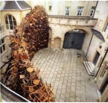
Installation - K. Tadashi, Delme