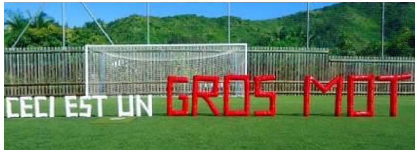
Classe de CM1, hommage à R. Magritte.

L' installation s'exprime le plus souvent dans un cadre tridimensionnel : même s'il s'agit a priori d'un simple tableau suspendu à un mur, l'artiste inclut l'environnement, ou d'autres facteurs, qui permettent de distinguer son œuvre du simple accrochage. Le travail est mis en situation et fait appel au hors-champ, à une dimension non immédiatement visible par la personne qui regarde : le simple fait d'inclure celle-ci en tant que « spectateur » convoque les notions de participation, d'immersion et de théâtralité.