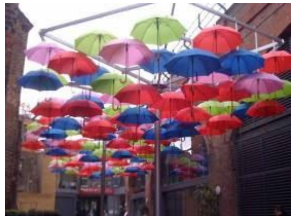
Festival d'art d'Agitageda, Portugal.