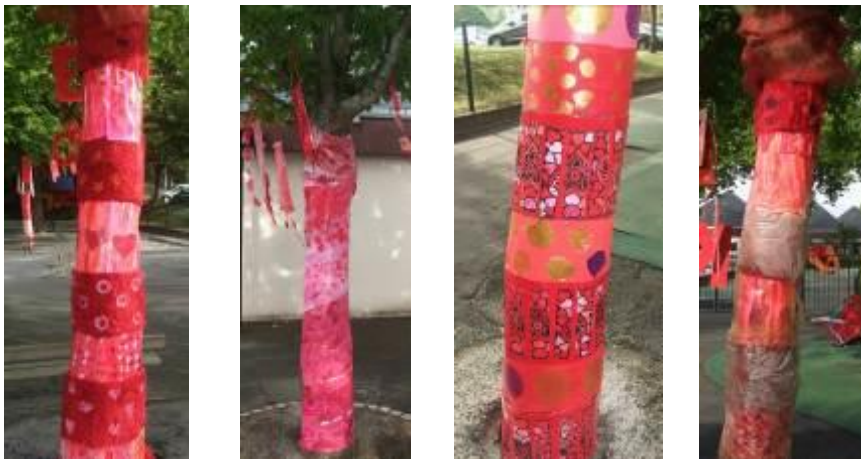
Dans la cour de l'école, quatre troncs d'arbres habillés..