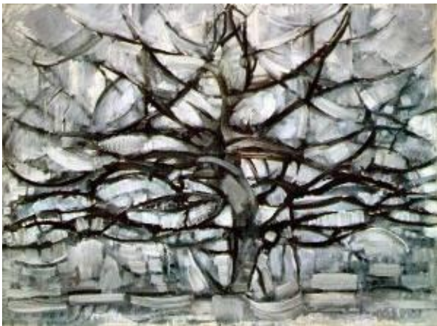
Arbre gris – 1911

Similitudes avec les réseaux autoroutier et sanguin, évoquant la circulation de sève.