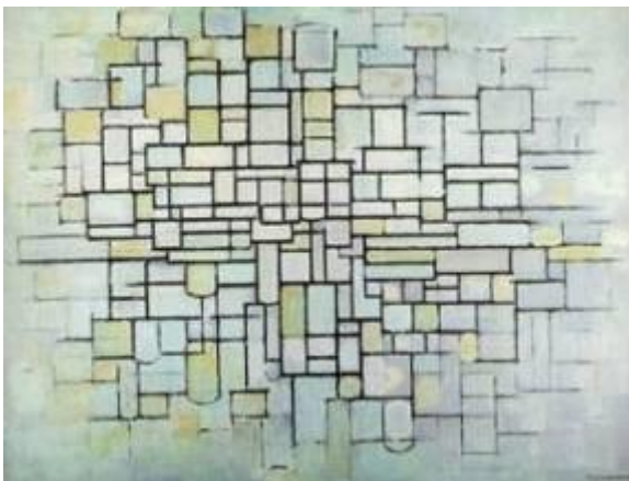
Lignes et couleurs - 1913

Devine-t-on encore un arbre ? Ou une impression d'arbre, d'entrelacs de branches, de lignes ? Le peintre témoigne ici de sa sensation de l'arbre... La réalité n'est plus essentielle, le réseau des branches et les lignes sont devenus le sujet du tableau.