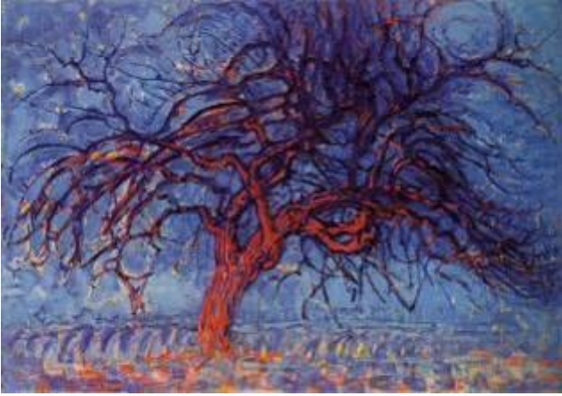
Arbre rouge – 1909

Portrait d'un arbre, plein cadre avec une ligne d'horizon marquée par des traces épaisses de pinceau