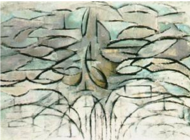
Pommier en fleurs – 1912

On s'approche du vitrail : différentes zones cernées de noir. Le peintre privilégie le réseau, les espaces entre les branches plus que l'arbre en tant que tel.