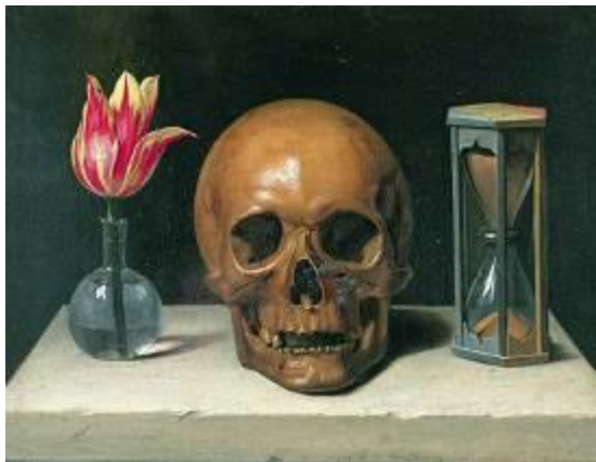
Vanité ou l'Allégorie de la vie - 1646 Philippe de Champaigne – Musée de Tessé