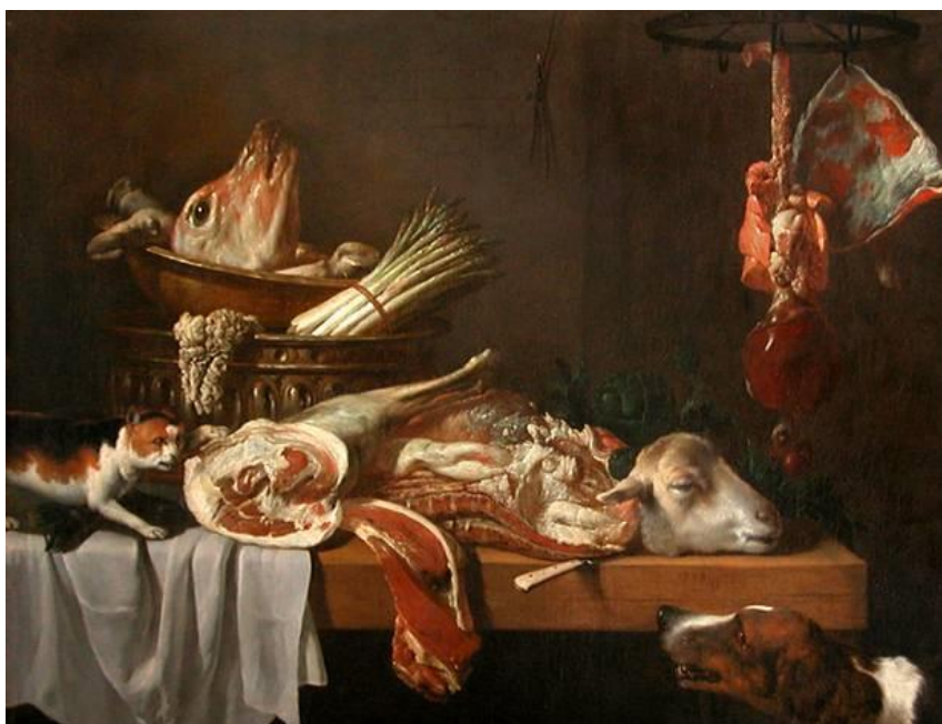
Viandes de boucherie avec chien et chat – Pieter Van Boucle – 1651

« Vanité » : nom donné à une nature morte qui rappelle à ceux qui la regarde : « Vanité des Vanités, tout est Vanité ... » « Memento mori : souviens –toi que tu vas mourir » (chapitre de l'Éclésiaste, la Bible).