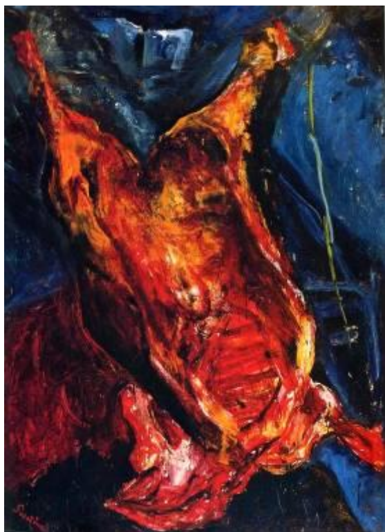
Le bœuf écorché - 1925 Chaïm Soutine