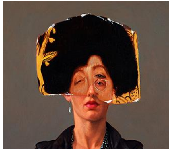
L'affiche de l'exposition -- 2013 Guy Brunet

L'inter iconicité ou citation iconographique, c'est la convocation explicite d'un fragment d'image dans une nouvelle image.