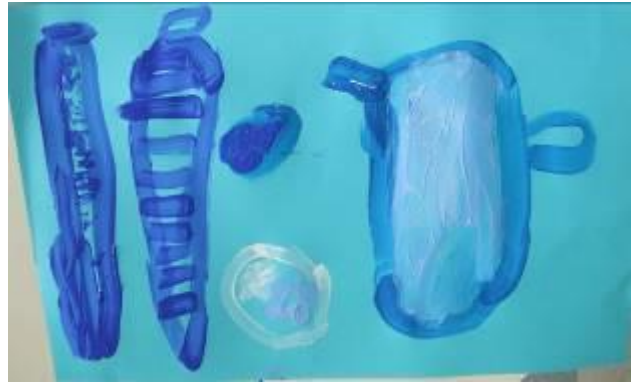
MS – école Pasteur - Allonnes