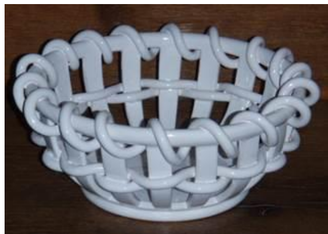
Corbeille ronde cordelée

Espace Faïence, rue Victor Hugo, 72270 Malicorne, Tel 02 43 48 07 17