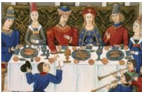
Banquet chez le duc et la duchesse de Bourgogne, XIVe siècle

Au Moyen Âge , les dépotoirs révèlent des vases de types différents (coquemars, pichets, amphores, cruches, marmites, écuelles, gargoulettes, poêlons, plats le plus souvent en céramique ; gobelets en métal, plus rarement en verre, etc.). Ainsi que de nombreux fragments de vaisselle essentiellement en céramique, parfois en métal, plus rarement en bois tourné (qui se conserve mal) ou en verre (la cessation quasi complète des échanges entre Orient et Occident au Moyen Âge entraîne un fort déclin de l'utilisation du verre pourtant en expansion chez les Romains), ces tessons étant associés à d'autres objets (boîtes, peignes, jouets, lampes, manche d'outils)