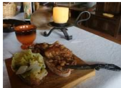
La tranche de pain sur laquelle on sert le poisson ou la viande à table (et qui sert d'assiette) au Moyen Âge .