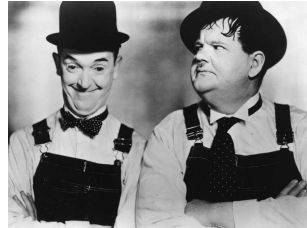
Laurel et Hardy