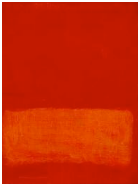
Mark Rothko, Sans titre , 1969

A l'école maternelle, l'enfant doit être capable d'observer et de décrire des œuvres du patrimoine : certains peintres ont joué avec les rouges.