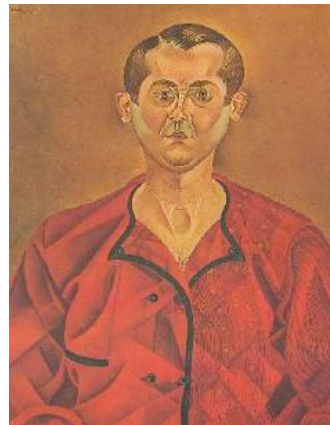
Juan Miro, Autoportrait , 1919