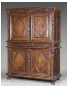
Une armoire antique