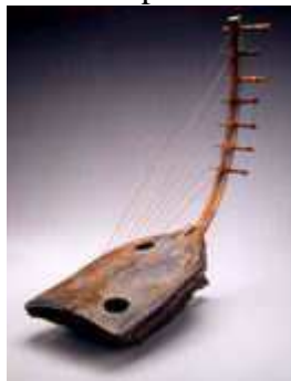
( Harpe Wamba, Congo)

Autre possibilité : un arc sur lequel sont tendues plusieurs cordes : la harpe