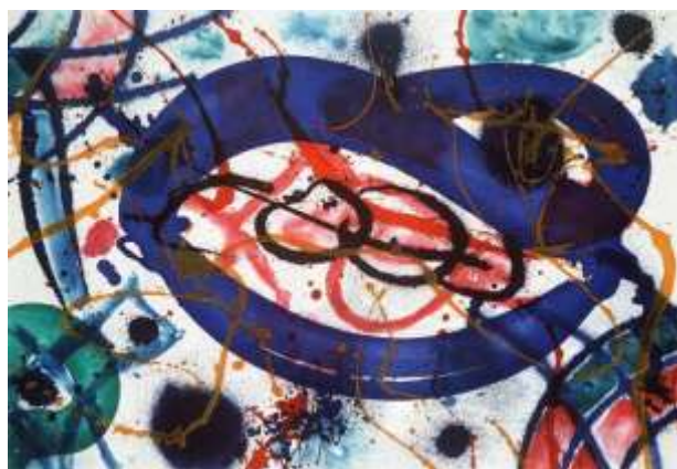
Trio II Sam Francis - 1991