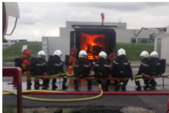
Le caisson de feu où les pompier en formation s'entraînent

Il faut savoir que depuis, tous les services du SDIS ont été regroupés à St Berthevin.