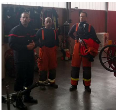
Les formateurs du plateau technique

Mardi 19 mars, ensemble cadets de l'Oriette et cadets de Craon, nous nous sommes rendus au SDIS 53 (service départemental d'incendie et de secours) et au CTA (centre des traitements des appels)