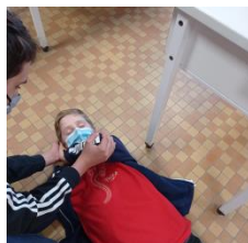
Il procède à la PLS : Position Latérale de Sécurité