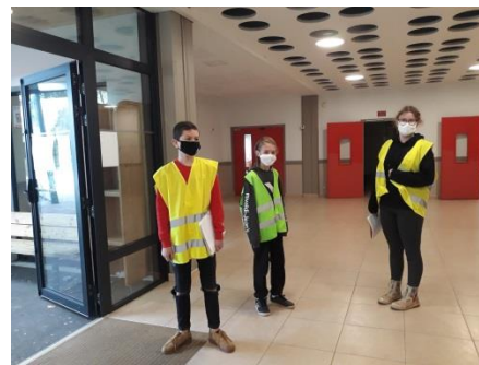
Les cadets en position pour le PPMS

L'alerte intrusion a retenti vendredi 13 novembre à 10h dans le collège. Les élèves Cadets de 3 ème étaient répartis dans divers endroits du collège avec une tenue reconnaissable (un chasuble, soit jaune soit vert).