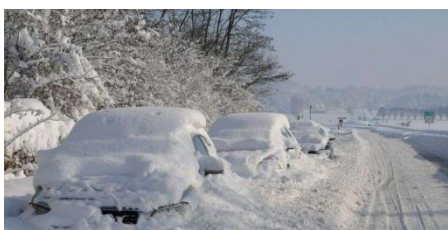
Voitures recouvertes de neige

Ines et Charlyne vous conseillent de consulter un site internet. En cas de verglas ou de neige sur la route, il y a des précautions à prendre.