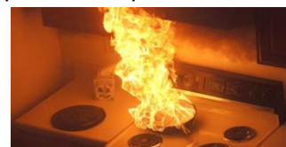
Début d'un feu sur une plaque de cuisson

En général, il est recommandé d'entretenir tous ces appareils chaque année, un professionnel est vivement recommandé pour vérifier l'état des appareils. Pensez aussi à nettoyer régulièrement votre système de ventilation.