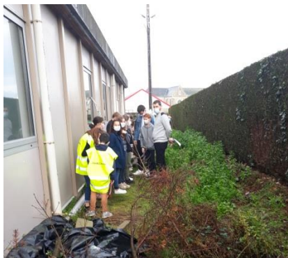
Une classe se met à l'abri en sortant dehors

Deux Cadets ont frappé sur toutes les portes pour imiter des terroristes essayant de pénétrer dans les classes. Pendant ce temps, d'autres cadets de 3 ème sont allés dans des salles de classes pour voir comment les professeurs et les élèves se comportaient, afin d'apporter des améliorations en cas de vraie intrusion.