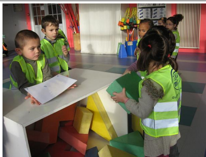
Architectes et magasiniers

Les « constructeurs » construisent les murs.