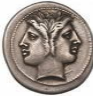
monnaie grecque avec double profil de Jupiter. 216 av JC