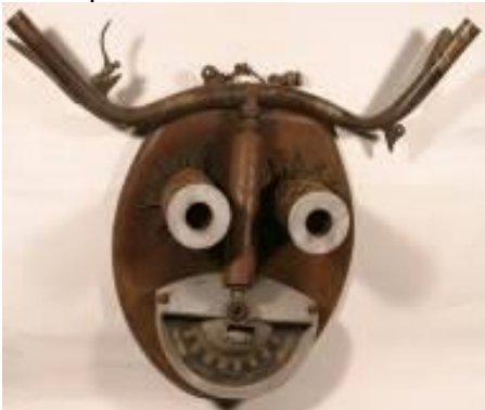
matériaux divers – G. Floquet

- Les artistes du récup'art nous proposent divers types de matériaux pour prolonger la recherche sur le portrait en volume :