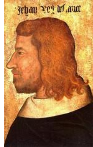
Jean le Bon, roi de France Anonyme - milieu du XIVè

De l'Antiquité jusqu'au Moyen Âge, dans la tradition, on privilégie le portrait de profil.