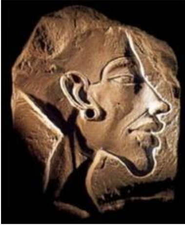
Akhenaton, portrait gravé Égypte ancienne

Toutefois le portrait joue aussi un rôle politique en permettant de renforcer le pouvoir des puissants (bustes, pièces de monnaie, sculptures...). L'image reste conventionnelle, la recherche de singularité s'efface au profit de la mise en place d'archétypes.