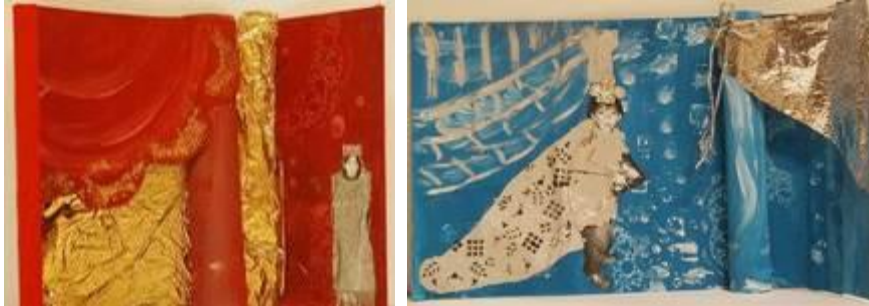
Réalisations CM2 de l'école Georges Lapiere au Mans