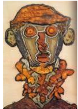
épluchures – P. Dereux

Cf. document UNE IDEE:UN ATELIER N° 22 - Arts plastiques et recyclage.