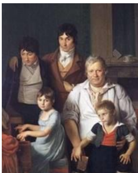
Portrait de famille, Anonyme, huile sur toile XIXème siècle.

Dans le cadre du parcours d'éducation artistique et culturelle, les élèves bénéficient de rencontres sensibles avec des œuvres qu'ils sont en mesure d'apprécier. Selon la proximité géographique, des musées, des ateliers d'art, pourront être découverts ; ces sorties éveillent la curiosité des élèves pour les activités artistiques de leur région.