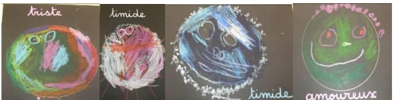
Visages expressifs, pastels gras- moyenne section, maternelle G. Braque - Coulaines.