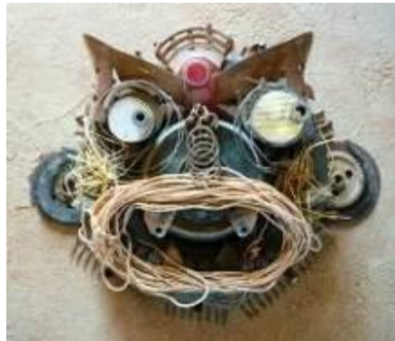
matériaux divers – Anonyme