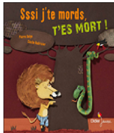
Sssi j'te mords, t'es mort ! Pierre DELYE, Cécile HUDRISIER, Editions Didier Jeunesse