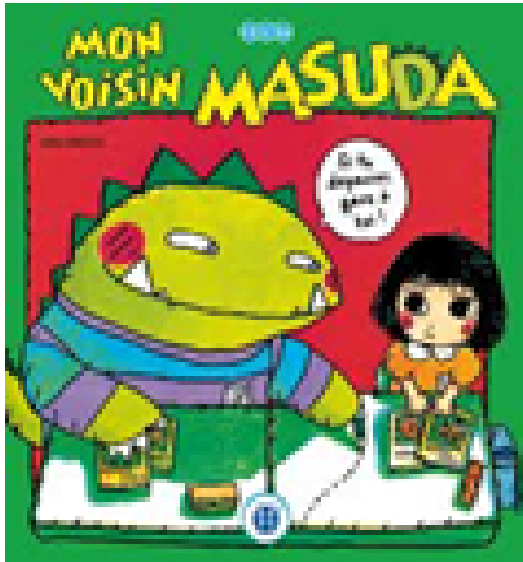
Mon voisin Masuda, Miho TAKEDA, éditions nobi nobi ! Collection :1, 2, 3, Soleil,