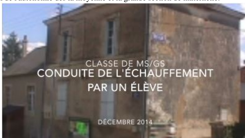
Illustration de la construction de l'autonomie dès la moyenne et la grande section de maternelle.

Film tourné en décembre 2014, monté en janvier 2015 par les conseillers pédagogiques en EPS