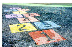
La récréation et les gestes barrières