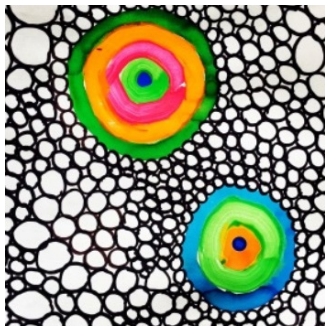
Enseigner la langue française

La langue française fait partie du domaine 1 intitulé Des langages pour penser et communiquer . Tous les enseignements concourent à la maîtrise de la langue. Aux cycles 2 et 3, l'apprentissage de la langue française s'exerce à l'oral, en lecture et en écriture .