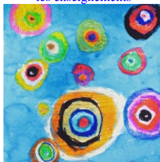
Actions et concours départementaux académiques et nationaux