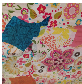
Scolarisation des -3 ans