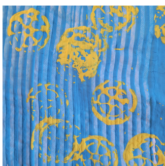
Organiser une école bienveillante