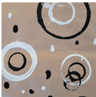
Actualités de l'école maternelle

L'école maternelle est une école bienveillante, plus encore que les étapes ultérieures du parcours scolaire. C'est aussi une école ambitieuse qui s'appuie sur un principe fondamental: tous les enfants sont capables d'apprendre et de progresser. Sa mission est de donner envie aux enfants d'aller à l'école pour apprendre, pour affirmer et épanouir leur personnalité, pour exercer leur curiosité sur le monde qui les entoure, tout en respectant le rythme de développement de chacun. En montrant à chaque enfant qu'il est capable d'apprendre avec succès dans toutes sortes de situations, l'école maternelle l'engage à avoir confiance dans son propre pouvoir d'agir et de penser, dans sa capacité à apprendre et réussir sa scolarité et au-delà. En lui apprenant à collaborer avec les autres, notamment par le jeu, elle place la socialisation comme l'une des compétences fondamentales à acquérir. BO n°25 du 24-6-21