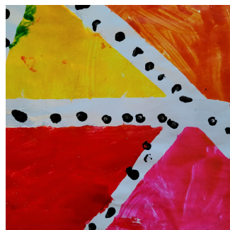
École maternelle numérique et EMI