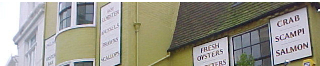
Brighton The Lanes