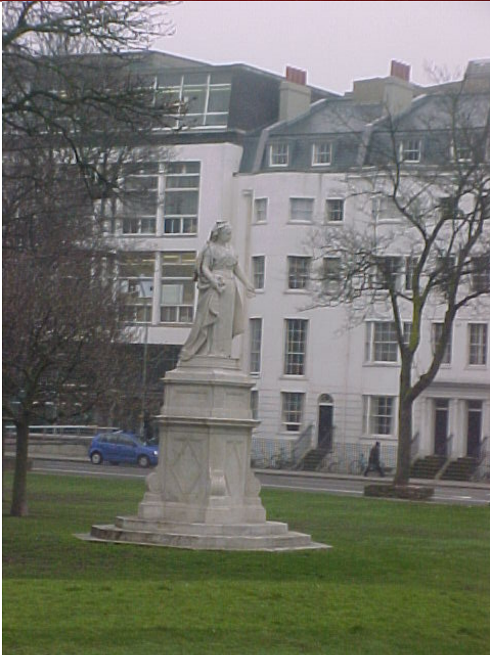
La reine Victoria