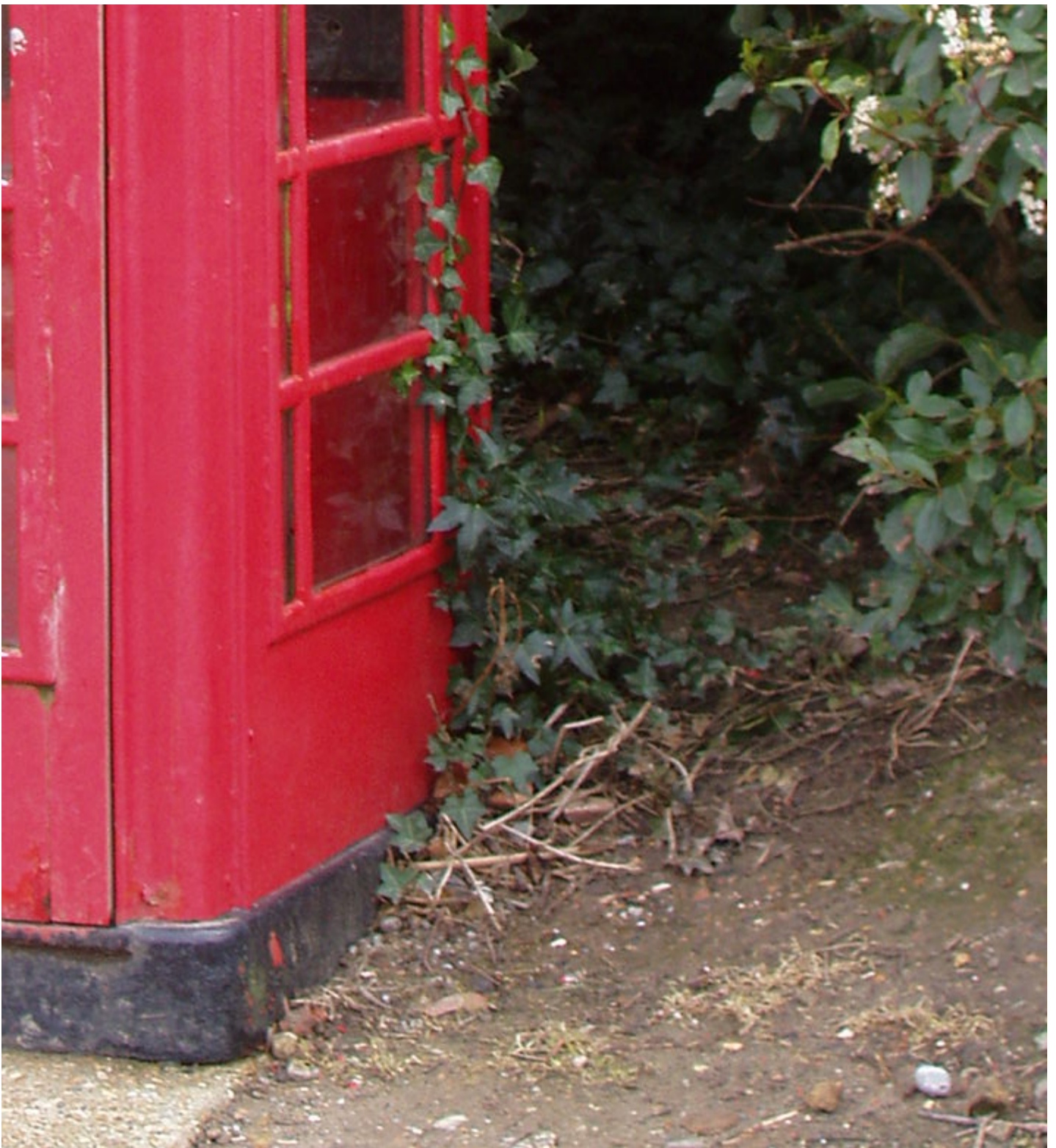
A phone box