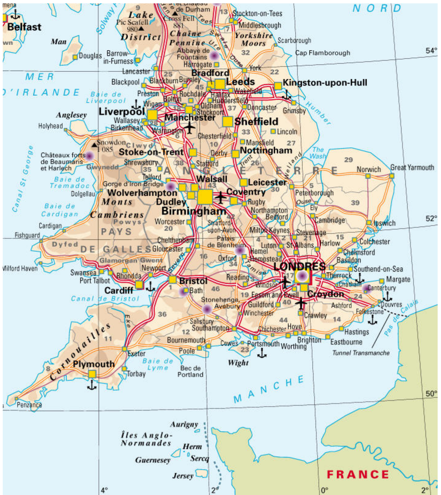
Carte du Royaume Uni