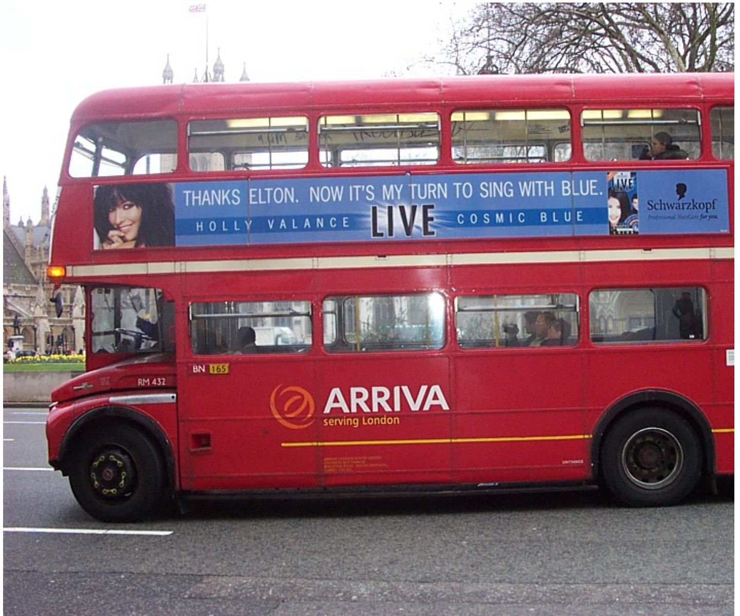
a double decker bus