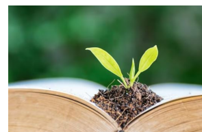
Le Livre Vert - Le Mans

RÉSEAU DES MÉDIATHÈQUES & Archives Le Mans LA VILLE