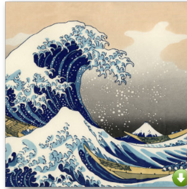
La grande Vague de Kanagawa