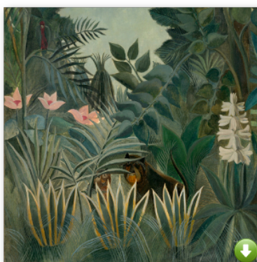
La jungle équatoriale